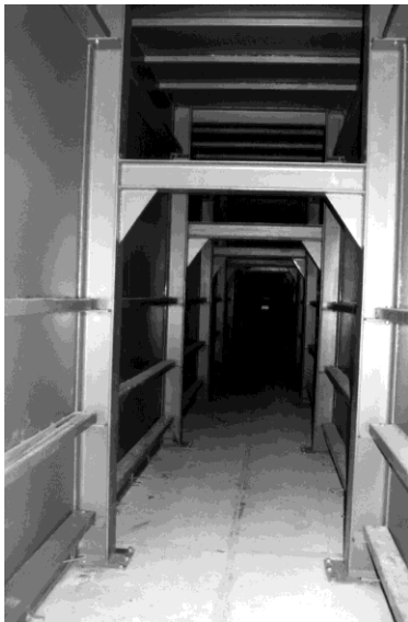
Hauptluftkanal bis 5,0 m hoch siehe Seite 54 Trapezwände