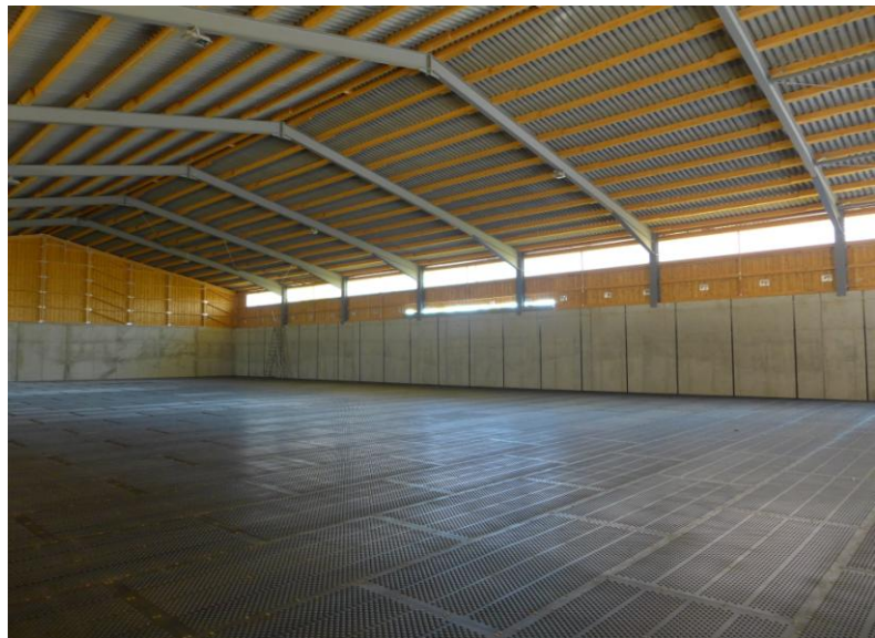
Getreideflachlager mit Belüftungstrocknung