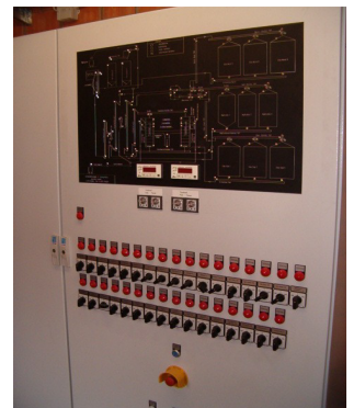
Schaltschrank mit Fließplan